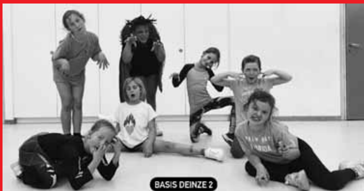
BASIS DEINZE 2