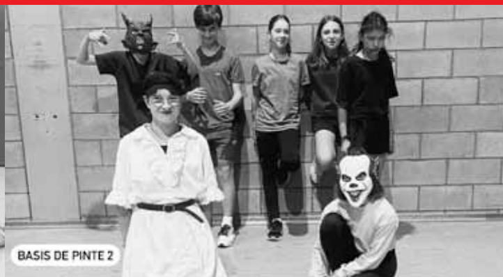
BASIS DE PINTE 2